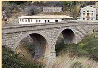
Puente de Navarza (1926)