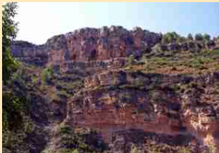
Las Cuevas de los Herreros